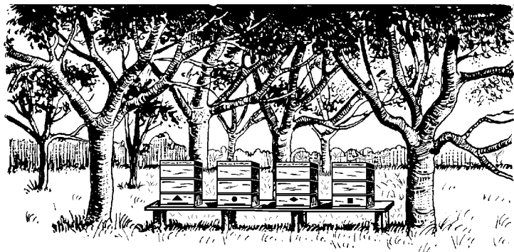
Boomgaard met bijenkasten

woorden. Het gehele programma duurt ca. 1,5 uur.