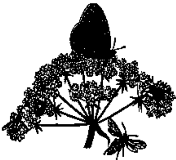
Schermbloem met verschillende insecten

Dat maakt maar weer eens duidelijk hoe planten en dieren elkaar nodig hebben.